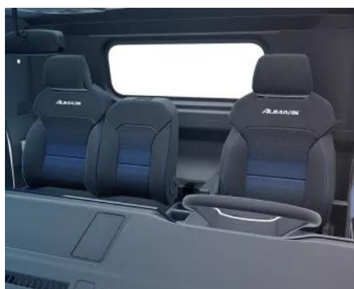
Conforto premium e acabamento sofisticado